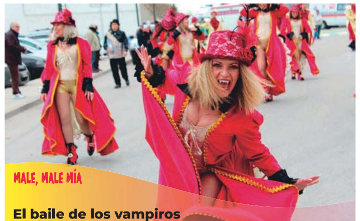
MALE, MALE MÍA