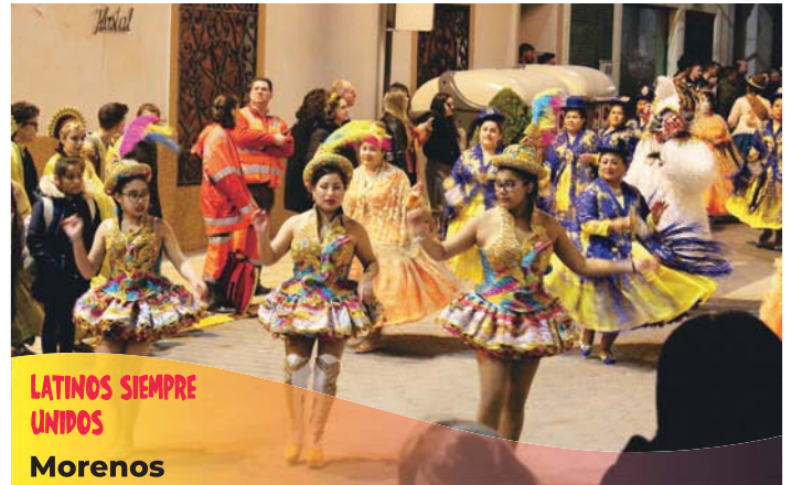
LATINOS SIEMPRE UNIDOS