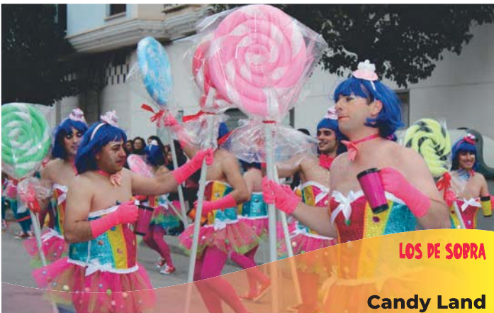
LOS DE SOBRA