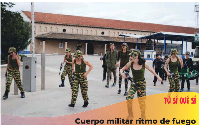
TÚ SÍ QUÉ SÍ